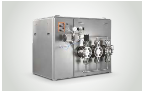
LEWA Homogenisator System basierend auf einer LEWA triplex Membranpumpe mit Homogenisierungsventil für aseptische Anwendungen.