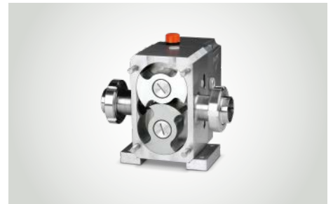
Pomac* Drehkolbenpumpen für hygienische Standard-Applikationen bis hin zu komplexen sterilen Anwendungen mit dünnflüssigen, viskosen oder scherempfindlichen Medien.