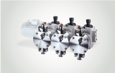
LEWA ecoflow hygienic Dosier-Membranpumpen im flexiblen Baukastensystem für mittlere und hohe Drücke in der Pharma-, Kosmetik- und Lebensmittelindustrie.