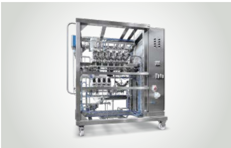
Kundenspezifische LEWA Systeme Maßgeschneiderte Lösungen für unterschiedliche Clean Markets-Applikationen wie z.B. Pufferin-line-Verdünnungsanlagen oder Dosiersysteme.