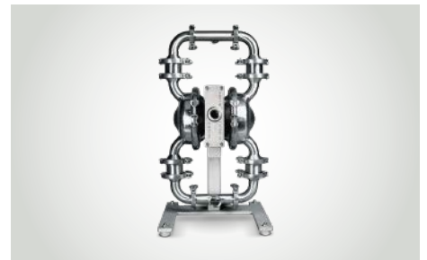
WILDEN hygienic* Druckluftpumpen zur schonenden Förderung scherempfindlicher Produkte im Hygiene- bzw. Sterilbereich