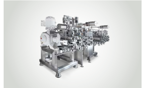
LEWA triplex hygienic Prozess-Membranpumpen für hohe Drücke und kritische, toxische, brennbare, dünnflüssige, nicht schmierende Fluide oder abrasive Suspensionen.