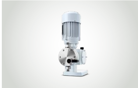
LEWA ecodos hygienic Dosier-Membranpumpen für niedrige Drücke in der Pharma-, Kosmetik- und Lebensmittelindustrie.