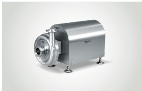
Pomac* Edelstahl-Kreiselpumpen für dünnflüssige Medien in Hygienebereichen